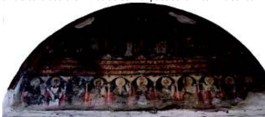
Fig. 10. Frescă din secolul XIX; timpanul de est.

Decenii mai târziu, poate în 1831, dacă e să luăm ca reper anul menționat pe crucea de altar comandată cu siguranță unui zugrav din Feisa, golul de deasupra tâmplei a fost zidit, iar timpanul rezultat a fost acoperit cu fresca ce, într-adevăr, este departe de calitatea artistică a podoabelor precedente ( fig. 10 ). Foarte probabil tot atunci pictura de secol XVII a fost văruiată, locul ei fiind luat de icoane împărătești aparținând aceluiași centru, dintre care cea a Sf. Nicolae se mai păstrează încă în biserică.