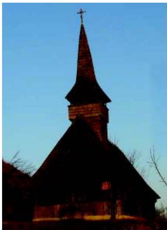
Fig. 17. Vechea biserică din Lunca Mureșului.