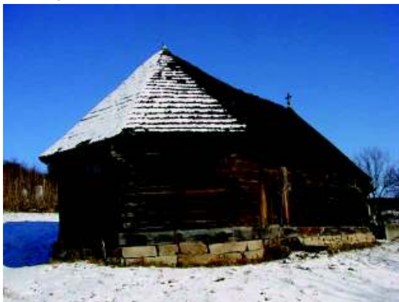
Fig. 12. Biserica "Sf. Nicolae", Cuștelnic.

ani înainte de executarea picturii atribuite de Ioana Cristache-Panait tot penelului lui Iacov de la Feisa 71 , nu mai rămâne loc de dubii în legătură cu ambientul confesional din comunitate 72 .