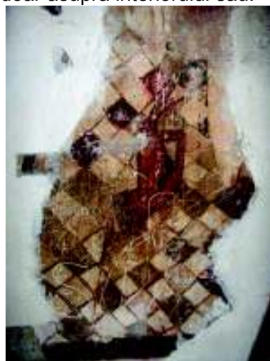
Fig. 5. Fragment de frescă din sec. XVII.

Dezafectată cultului în perioada 1906-1966, biserica a servit drept loc de refugiu pentru ciobanii care își pășteau turmele în zonă. Fumul numeroaselor focuri aprinse în zilele friguroase și scrijeliturile aplicate pe pereți au desfigurat chipurile sfinte din altar, iar ploaia scursă prin acoperișul căzut 60 le-a șters cu totul din naos, paragina aducând construcția în stare de ruină. Între 1966-1968 s-au desfășurat lucrări de consolidare la bolta altarului, iar pereții navei și ai pronaosului au fost tencuiți, cu excepția părților care mai păstrau încă urme din fresca demult ascunsă privirilor de văruiri succesive 61 .