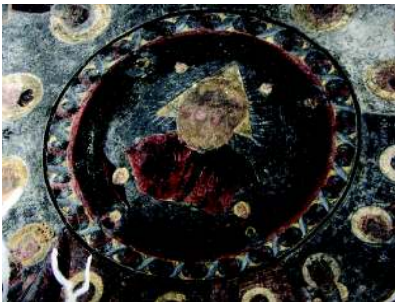
Fig. 11. Sf. Treime; cupola absidei.

prea deteriorată pentru a fi evident al căruia dintre ei este chipul, dar misterul poate fi dezlegat prin apelul la o icoană de la Galda de Sus, în mod evident inspirată de pictura din lăcașul de cult al comunității învecinate și în care tema este construită cu ajutorul chipului Mântuitorului.