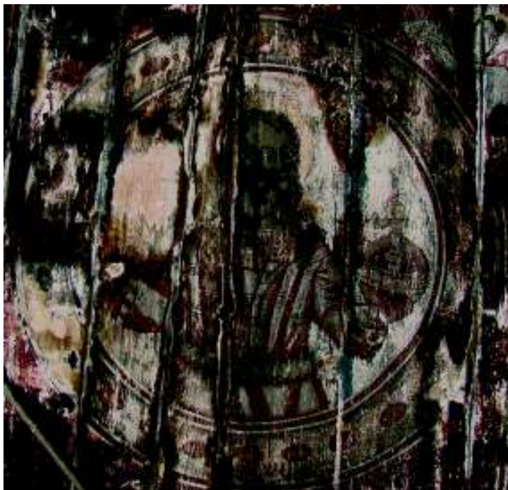
Fig. 19. Sfânta Treime; bolta naosului.

În vara anului trecut când lumina puternică a unei lămpi de video-proiector a scos-o din uitare și i-a revelat strania frumusețe.