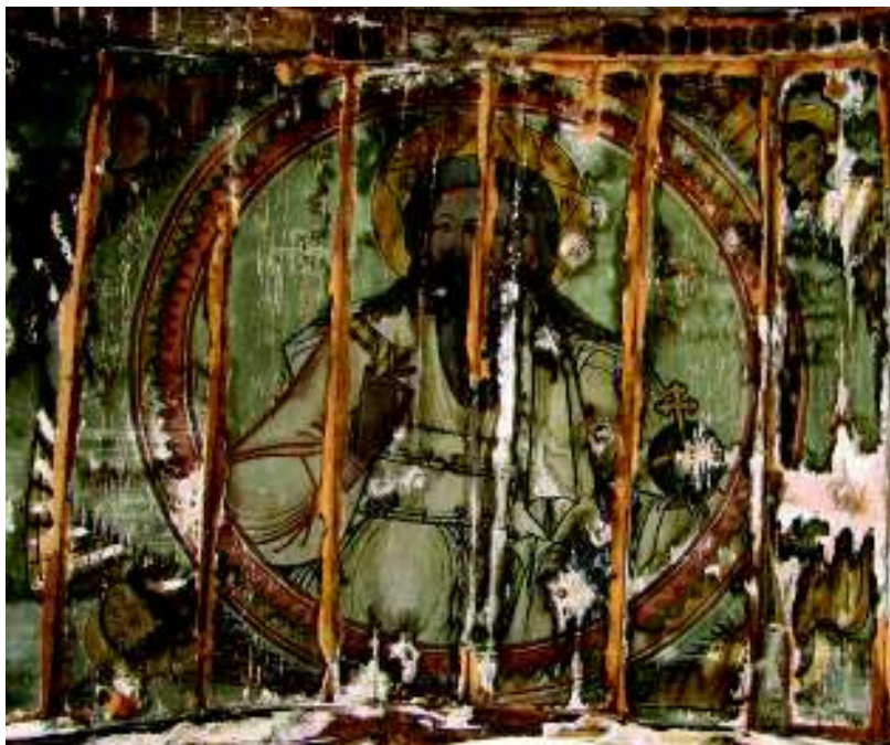
Fig. 14. Sf. Treime; bolta altarului.

detașată de gestul binecuvântării, pe care îl schițează cu mâna dreaptă, în vreme ce stânga ține globul cruciger. Nimbul stelat al Celui vechi de zile, conținând însă monogramul lui Iisus, este înscris într-un al doilea nimb, circular, ambele aureolând un păr cărunt ce cade pe umeri, lăsând liberă o frunte luminoasă. Redat cu grijă pentru detaliu, la fel ca și bărbile care coboară pe piept până aproape de cingătoarea veșmântului, acesta contrastează flagrant cu obrazul tânăr și delicatetea mâinii care schițează binecuvântarea. Stranietatea figurii întreține permanent senzația de confuzie a vârstei, iar combinarea ingenioasă a accesoriilor demonstrează o exemplară seriozitate a artistului, care induce gândul că avem de-a face cu o nouă viziune teologică asupra temei (fig. 14).