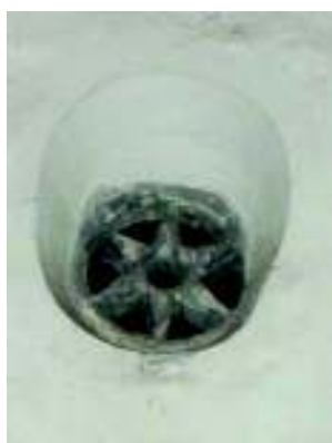
Fig. 4. Fereastră circulară gotică.

În jurul lui 1732 – declarat anul edificării în Șematismul de la 1900 59 – biserica a fost amplificată spre vest, adăugându-i-se pronaosul suprapus de turnul-clopotniță, accesul fiind de acum posibil dinspre sud, printr-un portal baroc cu decor stilizat. Din acel moment, înfățișarea exterioară a lăcașului nu va mai suferi modificări, atenția ctitorilor concentrându-se doar asupra interiorului său.