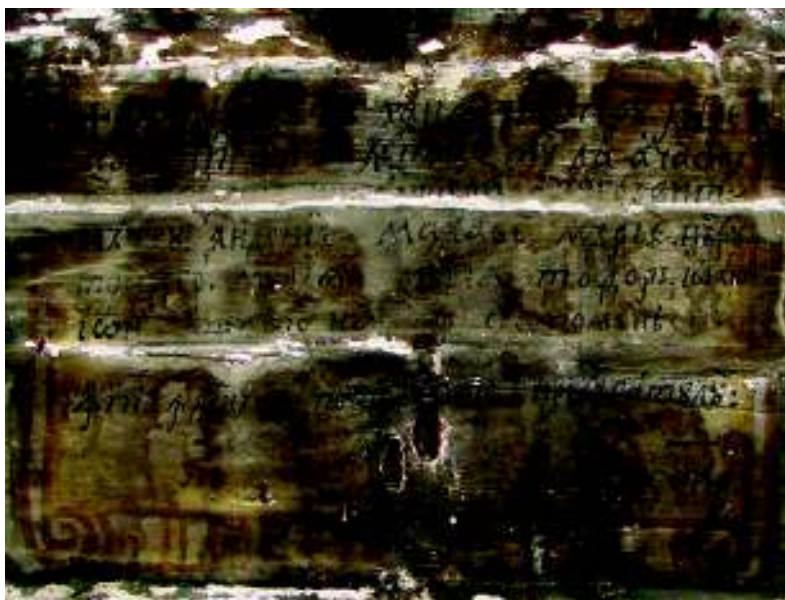
Fig. 13. Pisania cu mențiunea anului executării picturii altarului.

când Iacov se pare că nu mai era în viață 73 , astfel că ele au fost atribuite lui Nicolae, foarte probabil ca o consecință a plăcuței impresii pe care arta părintelui său o lăsase locuitorilor Cuștelnicului. În virtutea acestui respect, noua pictură a fost semnată “zugrăvi Popa Nicolae Iacovi, Ban Vasilie”, ascendența lui Nicolae fiind menționată cu pioșenie parcă și, în același timp, ca pentru a atenua dezinteresul lui Iacov de a-și asuma paternitatea asupra frescei din 1756.