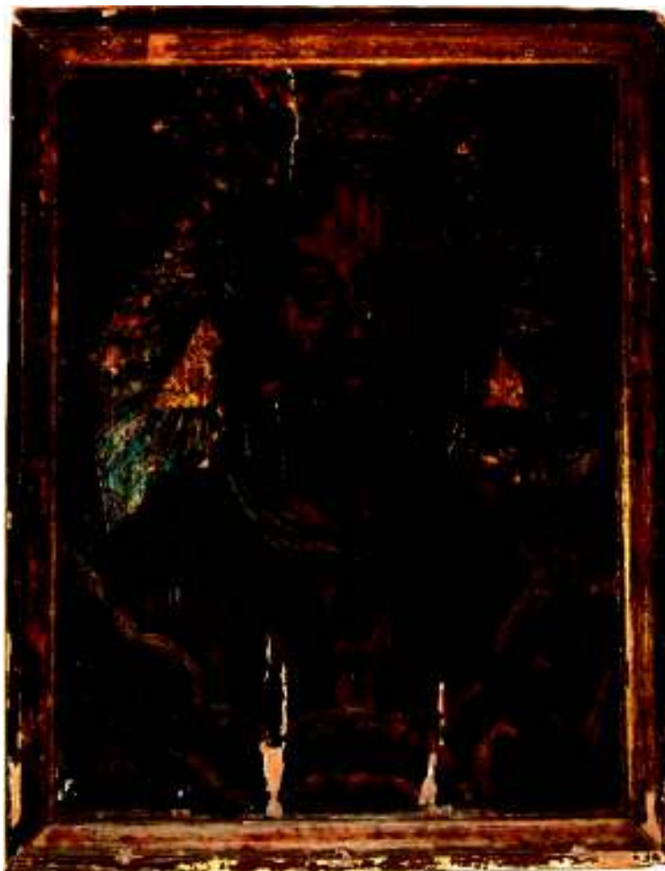
Fig. 16. Sf. Treime; Stan din Rășinari (atribuire), 1782 (?); Galda de Sus. remarcabilă și trăsături ce pot fi regăsite în icoanele semnate de Stan din Rășinari îl indică pe acesta drept posibil autor. Prezența sa certă la Galda de Sus, la doar câțiva kilometri de opera similară a fratelui său Iacov și – de ce nu? – propria deținere a modelului, încă din vremea anilor de ucenicie, sunt argumente în favoarea paternității sale asupra icoanei pe care certamente găldenii i-au cerut-o și față de care ei au manifestat o devoțiune specială, păstrând-o la loc de cinste, poate pe vechiul iconostas, cu o candelă aprinsă