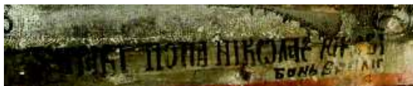
Fig. 18. Semnăturile zugravilor.

Starea de conservare a picturii este foarte precară. Ajunsă în stare de ruină, biserica a stat câțiva ani cu acoperișul distrus, ploaia reușind în anumite porțiuni să spele cu totul de pe pereți siluetele sfinte. Datorită degradării și a întunericului, Sf. Treime cu trei fețe, redată într-un medalion pe bolta naosului, a fost confundată cu chipul Patocratorului 82 , rămânând astfel inedită până