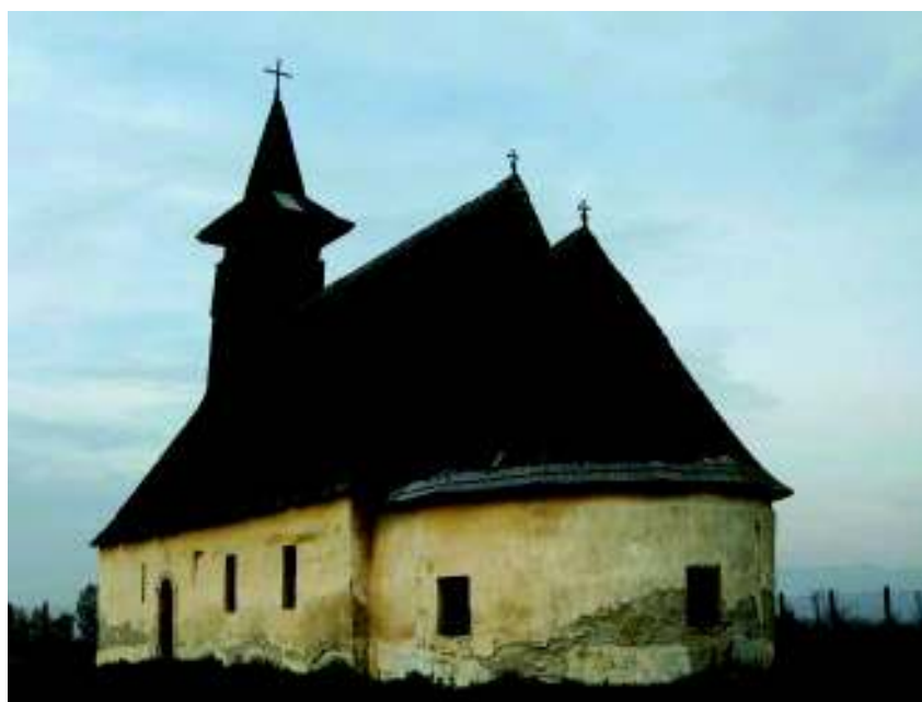
Fig. 3. Vechea biserică din Galda de Jos.

lului al XVI-lea, mult mai probabil însă după 1599, când Galda a devenit posesiune a Mitropoliei Ortodoxe 58 . Foarte probabil ca urmare a acestui înalt patronaj, cândva în secolul XVII un zugrav de mare talent a împodobit cu pictură cel puțin tâmpla, pe care mai pot fi admirate și astăzi resturi ale frescei cu reprezentarea Sf. Nicolae (fig. 5).