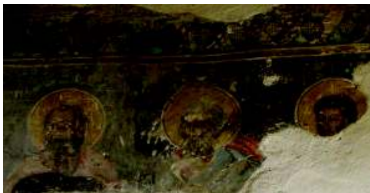
Fig. 9. Figuri de apostoli; pronaos.

care îngreunează comparația cu alte lucrări ale artistului, în special cu cea similară ca tehnică de pe cupola catedralei din Blaj, a cărei calitate de a fi restaurată complică și ea destul de mult lucrurile. Se observă însă preocuparea pentru redarea minuțioasă a coafurii și bărbilor, delicata arcuite a sprâncenelor, grija pentru reliefarea nasurilor și atribuirea unei individualități foarte precise fiecărui chip (fig. 8-9), iar repertoriul de motive decorative cu adânci rădăcini în arta brâncovenească, dar din a căror răspândire Iacov Zugravul și urmașii săi și-au făcut parcă o vocație, este de asemenea bine reprezentat.