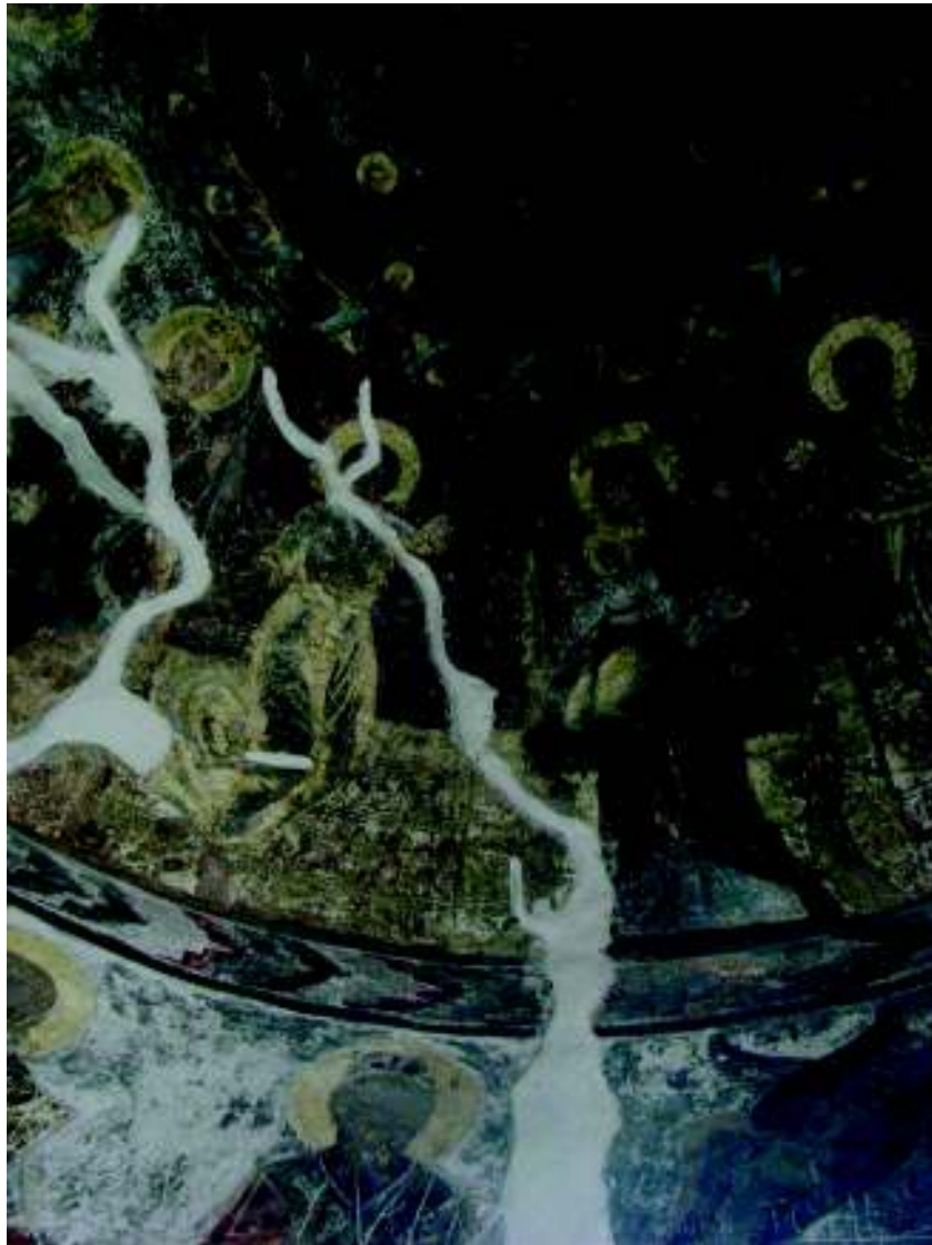
Fig. 7. Imagine de pe cupola absidei.

Obiectul acestei analize este în primul rând pictura din absida altarului, care conține și datarea 1752, despre care observăm că