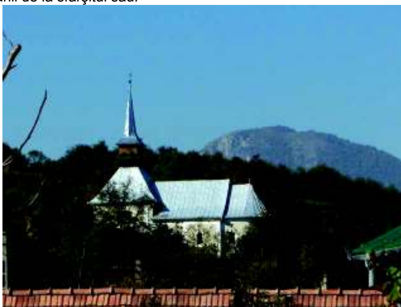
Fig. 15. Biserica din Galda de Sus.

pe măsură, apoi, în 1803 a fost zugrăvit altarul și în 1804 a fost montat somptuosul iconostas, este mai de presupus că biserica a fost înălțată în prima jumătate a secolului al XVIII-lea decât în anii de la sfârșitul său.