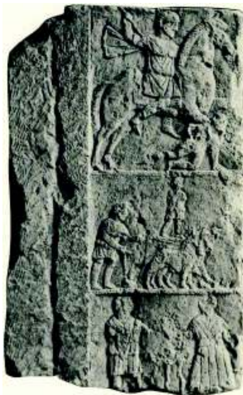
Fig. 9. Perete lateral drept de aedicula , descoperit în vara anului 1857 la Șeica Mică (Muzeul Național de Istorie a României, București).

Informația potrivit căreia între cele două personaje care se țin de mână în scena banchetului funerar s-ar fi aflat inițialele I (sau T ) și S a fost preluată fără control în CIL 967. Ulterior s-a publicat o rectificare a lecturii eronate făcută de S. Mökesch, care ar fi confundat picioarele mesei cu această monogramă. ( mense tripens ) 25 . Autorul acestor rânduri nu subscrie acestei