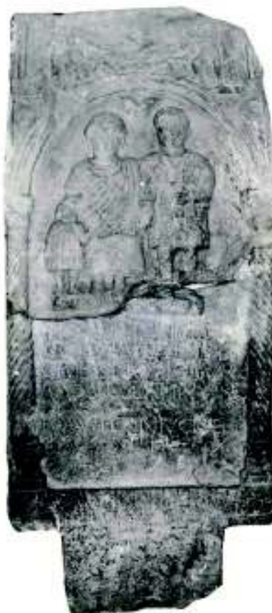
Fig. 2. Inscripția CIL III, 966 = IDR III/4, cu rol de perete posterior de aedicula (Muzeul Național Brukenthal, Sibiu)