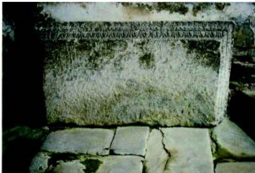
Fig. 7.- Baza netedă și profilul acoperișului de aedicula .

Al doilea monument litic, descoperit exact în același loc, trebuia să fie, după intuiția lui Ackner, un perete (“înveliș”) al acoperișului de aedicula , în timp ce perechea lui trebuia să se afle, după părerea aceluiași arheolog, la o adâncime mai mare, dacă nu cumva fusese transportat în altă parte, distrus și folosit ca material de construcție. Peretele de aedicula n-a fost întreg, lipsind o fâșie din marginea de sus, cu chenarul laturei, înguste și o parte a registrului inferior, cu reprezentarea lui Attis . Lipsește, prin urmare, partea jos a piciorului stâng a acestui personaj foarte frecvent întâlnit la această categorie de monumente funerare ( fig. 8 ). De la data publicării acestui perete de aedicula de Gr. Florescu și E. Panaitescu 21 , el a mai cunoscut unele deteriorări pe marginea stângă și mai ales la colțul din stânga jos. Atât la cei doi autori amintiți mai sus, cât și la O. Floca și Wanda Wolski, acest monument litic apare la categoria peretilor