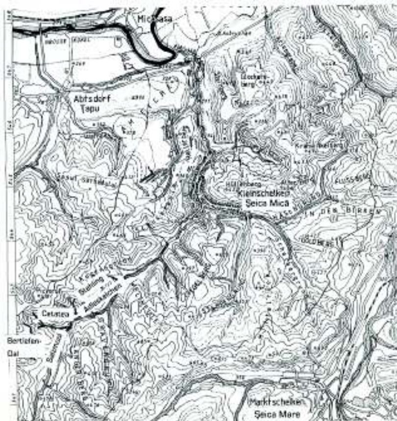
Fig. 1. Planul zonei Șeica Mică – Șeica Mare. După ridicarea francisco-iosefină (1873-1887), sc. 1:25.000

O altă descoperire, ce tratează aspecte din viața cotidiană a Daciei romane, nelipsită din aproape nici o publicație, itinerată și în străinătate la diferite expoziții ca o piesă mai deosebită (cu caracter de unicat), transferată apoi definitiv de la Muzeul Brukenthal la Muzeul de Istorie a României din București 5 , este peretele lateral al unei aedicula , descoperit în hotarul comunei Șeica Mică 6 .