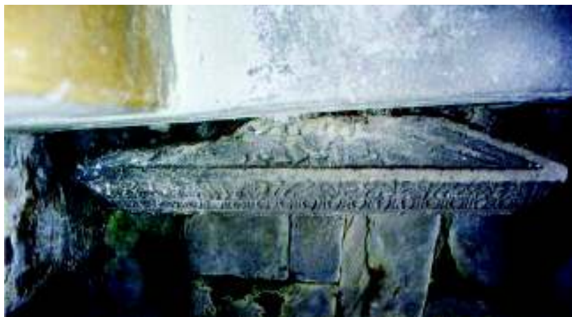
Fig. 4. Acoperișul aediculei descoperite în 8-9 mai 1857, păstrat în partea de nord a pronaosului bisericii evanghelice din Șeica Mică.

Acoperișul, lucrat în două ape, cu fronton triunghiular în față, a fost distrus probabil încă în Antichitate, adică trunchiat în linie aproximativ dreaptă de la un capăt la altul, ceva mai jos de creasta mediană ( fig. 4 ). Așadar, lipsește și vârful frontonului, unde, după descrierea nepublicată a lui Ackner, s-ar fi aflat partea superioară a capului Meduzei, imagine sugerată de prezența unor cozi încolăcite de șarpe. Descrierea sculpturii se încheie cu observația că în aceeași zonă mai erau reprezentați și doi păuni afrontați.