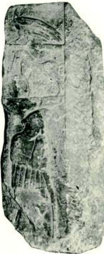
Fig. 8. Perete lateral stâng de

Piesa, sculptată dintr-un calcar mai dur, reprezintă fără îndoială peretele lateral stâng al unei aedicula , împărțit, prin chenare profilate orizontale, în trei registre. În cel superior este reprezentat un păun cu capul întors spre spate, ținând în plisc un șarpe lăsat în jos, cu coada încolăcindu-se în jurul piciorului său drept. În registrul mijlociu apare un cal în mers liniștit, mișcându-se spre stânga, iar în cel inferior este reprezentat Attis în poziția obișnuită, jumătate întors spre dreapta, rezat cu mâna dreaptă și cu cotul mâinii stângi în bastonul de păstor ( pedum ). Pe cap poartă nelipsita bonetă frigiană, este înveșmântat într-o tunica mai lungă, peste care este pusă alta mai scurtă, cu mâneci lungi, tunica manicata , încinsă la mijloc și prevăzută de la brâu