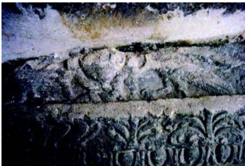
Fig. 6. Latura din față (frontonul) a acoperișului de aedicula .

Din cauza distrugerii părții superioare a acoperișului de aedicula , prin retezarea “coamei”, lipsesc din cupa tip kantharos gâtul, buza de obicei evazată și toartele supraînălțate ( fig. 6 ). Tipul de vas kantharos , zis și “paharul lui Nestor”, apare frecvent ca atribut al lui Dionysos. În studiile de specialitate referitoare la ornamentarea acoperișurilor orizontale de aedicula cu fronton triunghiular din Dacia romană nu se cunosc analogii pentru acest decor 20 .