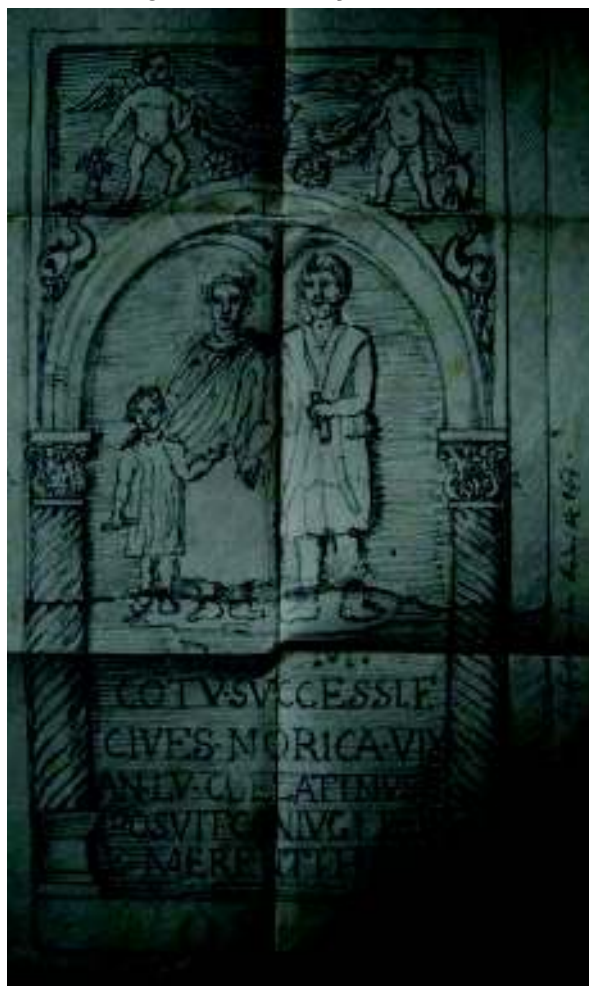
Fig. 3. Desenul făcut de J. M. Ackner la locul de descoperire a inscripției.

Sub imperiul animației declanșate de o descoperire atât de importantă în plin centrul comunei Șeica Mică, în 8 și 9 mai 1857 s-a efectuat o săpătură mult mai adâncă, în dreptul locului în care apăruse stela funerară. Cu acel prilej au ieșit la lumină alte două monumente funerare, și anume un acoperiș și un perete lateral de aedicula , despre care Ackner spune în raportul său nepublicat că erau prevăzute cu sculpturi mult mai frumoase decât stela funerară găsită în același loc cu un an înainte.